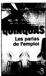
Quinquas : les parias de l'emploi, Alain Vincenot, Belfond, 2006, 300 p., 18 €

Baignant dans un climat de confiance, il n'économise ni son temps ni son énergie. Jusqu'à ce qu'un rapprochement avec une société concurrente, rachetée par un groupe américain, ne déclenche en janvier 2000 cette brutale et inattendue mise au point